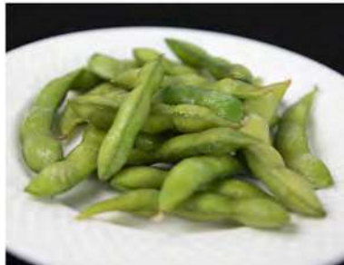
28/ Edamame €3,50 Bacelli di soia Allergeni: 6