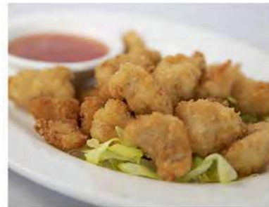
178/ Pepite di pollo fritto €5,50 Allergeni: 1, 3