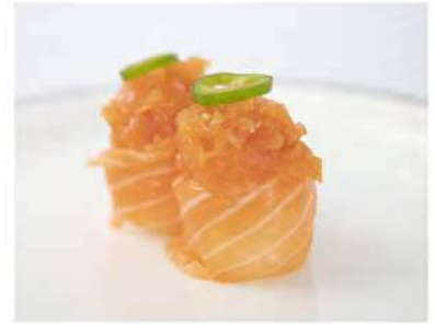
133/ Gunkan spicy sake €5,00 Bocconcini di riso avvolti con salmone, guarniti con tartare di salmone e salsa piccante