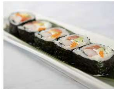
50/ Futomaki california (5pz) €6,00 Roll di riso farciti con surimi di granchio, salmone, philadelphia, avocado, tobiko, avvolti con alga nori Allergeni: 2, 7