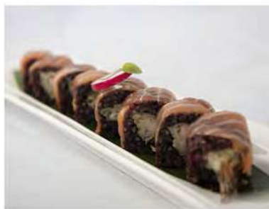
85/ Black tiger (8pz) €12,00 Roll di riso venere farcito con gamberoni fritti, maionese, guarnito con salmone e condito con salsa teriyaki Allergeni: 1, 2, 3, 6