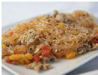
155/ Spaghetti di soia piccanti €5,00 Spaghetti di soia saltati con carne di maiale, cipolle e peperoni piccanti Allergeni: 1, 6