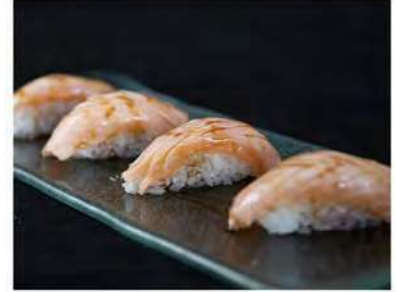
106/ Nigiri scottato (4pz) €6,00 Salmone scottato e salsa teriyaki Allergeni: 6