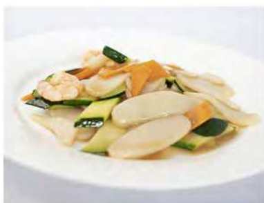
160/ Gnocchi €5,50 Gnocchi di riso con gamberi e verdure Allergeni: 1, 2