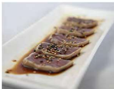
31/ Tonno tataki €10,00 Tonno scottato con sesamo condito con salsa ponzu Allergeni: 6, 11