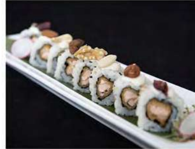
59/ Uramaki bb mix salmone (8pz) €9,00 Roll di riso farcito con salmone fritto e maionese guarnito con BB mix e salsa teriyaki Allergeni: 3, 6, 8, 11