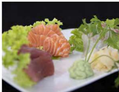
118/ Sashimi misto €10,00 Fettine di salmone, tonno e pesce bianco