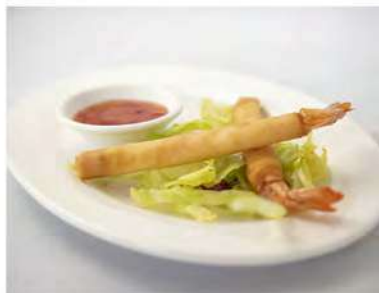
02/ Ebi stick €3,00 Gamberetti avvolti da pasta sfoglia con salsa orange Alleggereni: 1, 2