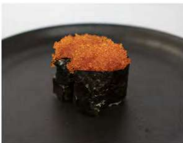
134/ Gunkan tobiko €5,50 Bocconcini di riso con alga nori guarniti con uova di pesce volante