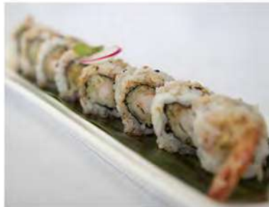
70/ Uramaki ebiten (8pz) €9,00 Roll di riso farcito con gamberoni fritti maionese e salsa teriyaki Allergeni: 1, 2, 3, 6, 11