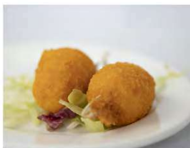
08/ Chele di granchio €3,00 Alleggereni: 1, 2