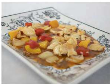
185/ Pollo in salsa piccante €5,50