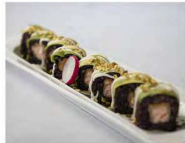
87/ Special pistacchi roll (8pz) €10,00 Roll di riso venere farcito con salmone fritto, maionese, ricoperto da avocado e pistacchi Allergeni: 1, 3, 8