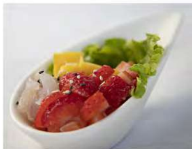
35/ Esotic tartare €9,00 Tartare di pesce misto e frutta Allergeni: 11