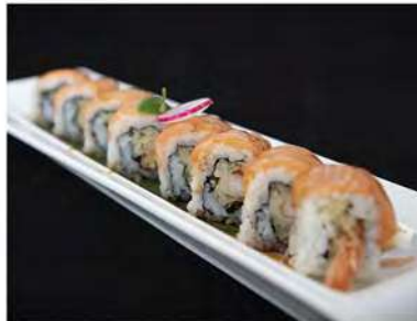
81/ Uramaki tiger roll (8pz) €12,00 Roll di riso farcito con gambero fritto e maionese, guarnito con salmone e condito con salsa teriyaki Allergeni: 1, 2, 3, 6