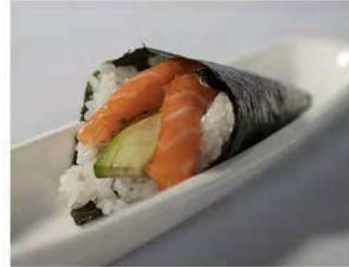
94/ Temaki sake €3,50 Cono di riso avvolto da alga nori farcito con salmone e avocado