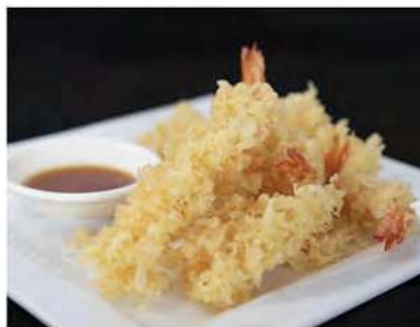
171/ Ebi tempura €10,00 Tempura di gamberoni Allergeni: 1, 2