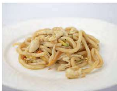
146/ Udon con pollo €7,00 Udon saltati con pollo e verdure Allergeni: 1