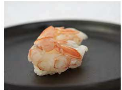
122/ Nigiri amaebi (2pz) €4,00 Bocconcini di riso con gambero crudo Allergeni: 2