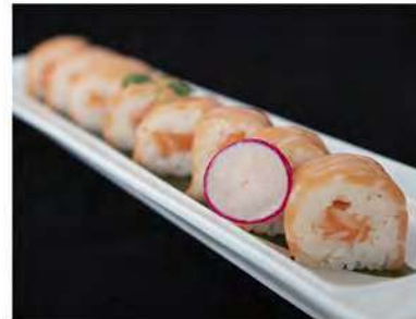
90/ Salmon fresh (8pz) €9,00 Roll di riso farcito con salmone