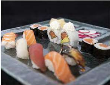
104/ Sushi misto €10,00 6 nigiri, 4 hosomaki, 2 uramaki Allergeni: 2