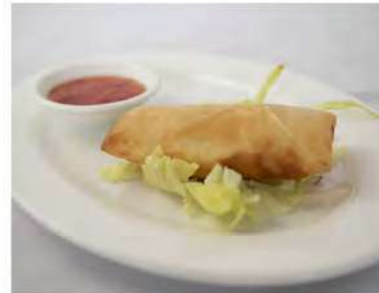
03/ Involtino primavera €2,20 Croccante involtino di pasta con ripieno di crauti e verdure miste Alleggereni: 1, 2, 3, 11