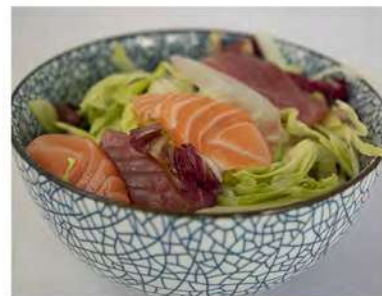
26/ Sashimi salad €7,50 Insalata con pesce misto crudo