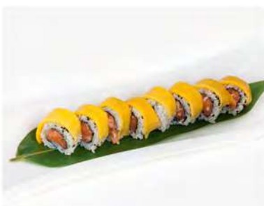
77/ Mango pistacchio roll (8pz) €12,00 Roll di riso farcito con salmone, avocado e philadelphia avvolto con mango e pistacchio in pezzi e salsa di mango Allergeni: 8