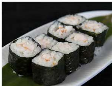
46/ Hosomaki ebi (8pz) €4,00 Roll di riso farciti con gamberetti cotti e avvolti con alga nori Allergeni: 2, 6