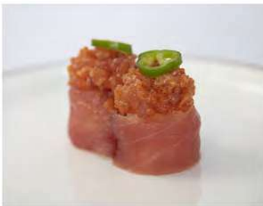
131/ Gunkan spicy tuna €5,00 Bocconcini di riso avvolti con tonno guarniti con tartare di tonno e salsa piccante