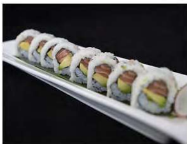
60/ Uramaki sake avocado (8pz) €8,00 Roll di riso farcito con salmone e avocado Allergeni: 11