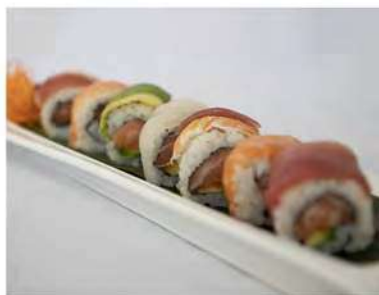
73/ Rainbow roll (8pz) €12,00 Roll di riso farcito con salmone avocado, guarnito con pesce misto