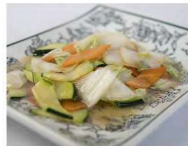
191/ Misto di verdure saltate €4,00 Verdure saltate con germogli di soia e funghi Allergeni: 6