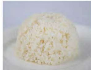
142/ Gohan €2,00 Riso bianco cotto al vapore Allergeni: 11