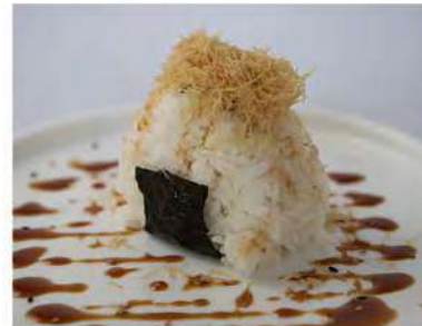
54/ Onigiri spicy salmon €5,00 Polpetta di riso triangolare farcita con salmone, maionese, tabasco e tobiko Allergeni: 3, 11