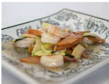
176/ Gamberetti alle verdure €6,00 Allergeni: 2