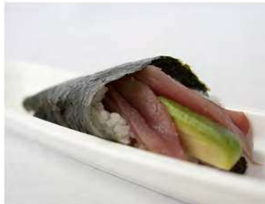
93/ Temaki maguro €4,00 Cono di riso avvolto da alga nori farcito con tonno e avocado