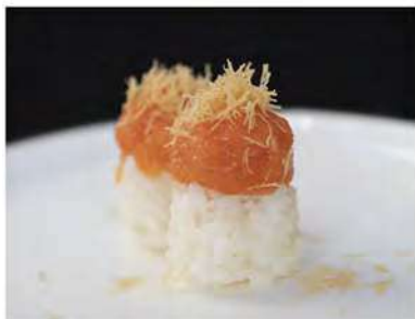
141/ Tamarizushi sake €5,00 Bocconcini di riso con tartare di salmone e maionese Allergeni: 3