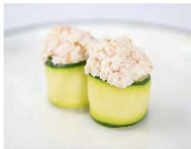
135/ Gunkan zucchine €5,50 Bocconcini di riso avvolti con zucchine guarniti con tartare di gamberetti, granchio e maionese Allergeni: 2, 3