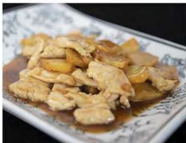
182/ Pollo con patate €5,50