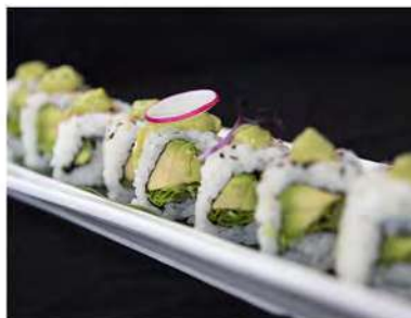
66/ Uramaki vegetale (8pz) €8,00 Roll di riso farcito con avocado insalata, cetriolo e salsa di rucola Allergeni: 11