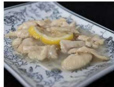
184/ Pollo con salsa al limone €5,50