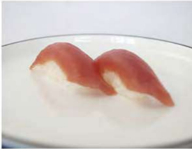
123/ Nigiri maguro (2pz) €4,00 Bocconcini di riso con tonno