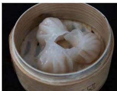
11/ Ravioli di cristallo €4,50 Ravioli di gamberi Alleggereni: 1, 2