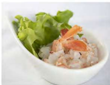
37/ Ebi tartare €6,00 Tartare di gamberi con salsa ponzu Allergeni: 2, 6, 11