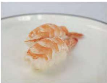
120/ Nigiri ebi (2pz) €3,00 Bocconcini di riso con gamberetto cotto Allergeni: 2