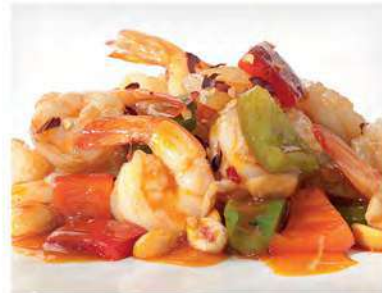
175/ Gamberetti in salsa piccante €6,50 Allergeni: 2