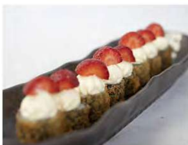
42/ Hosomaki strawberry (8pz) €6,00 Roll di riso avvolti con alga nori fritti, farciti con salmone e guarniti con philadelphia e fragole fresche con salsa teriyaki Allergeni: 1, 7