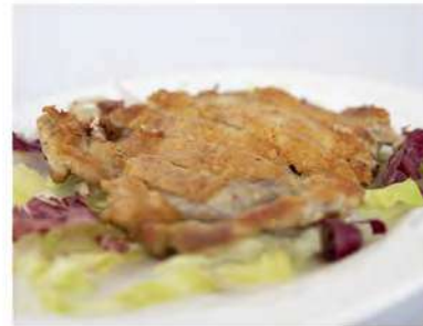
172/ Tonkatsu €7,50 Cotoletta di maiale fritta Allergeni: 1, 3