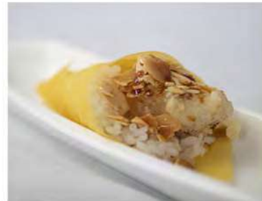
103/ Temaki gamberi fritti €4,50 Cono di riso avvolto da sfoglia di soia con gamberi fritti, mandorle e salsa teriyaki Allergeni: 2, 3, 8, 11