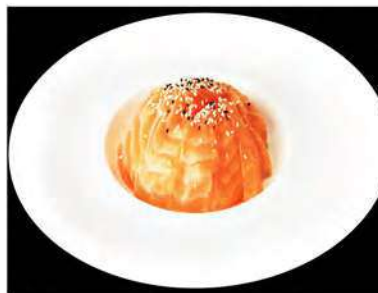
112/ Sake don €10,00 Base di riso con sashimi di salmone Allergeni: 11