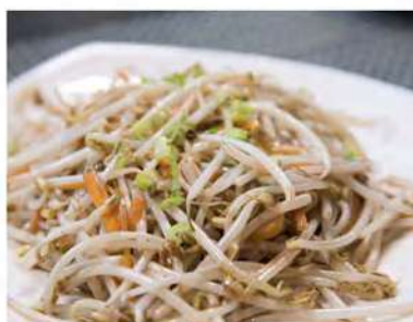
190/ Germogli saltati €4,00