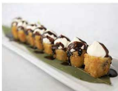
43/ Hosomaki special banana (8pz) €7,00 Roll di riso avvolti con pasta di riso farciti con banana e guarniti con cacao e philadelphia Allergeni: 11, 7