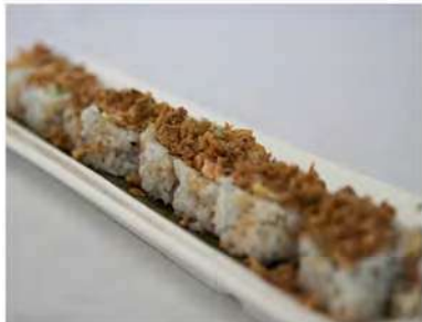
57/ Miura maki (8pz) €8,00 Roll di riso farcito con salmone saltato avocado, philadelphia, ricoperto da cipolla fritta e guarnito con salsa teriyaki Allergeni: 6, 7, 11