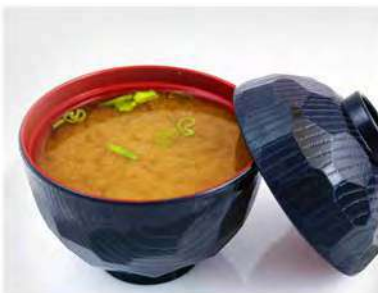
33/ Miso shiru €3,00 Zuppa di miso