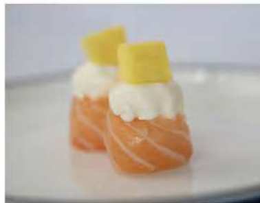
132/ Gunkan sake mango €10,00 Bocconcini di riso avvolti con salmone guarniti con philadelphia e mango Allergeni: 7