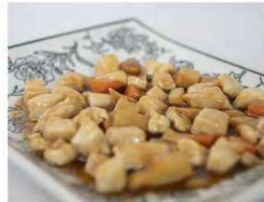
181/ Pollo alle mandorle €5,50 Pollo saltato con bambù e mandorle Allergeni: 8