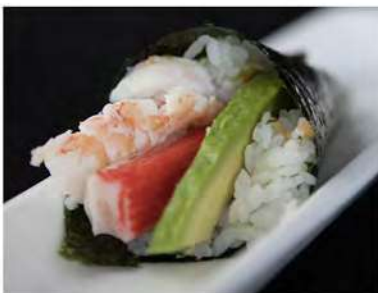
98/ Temaki california €3,50 Cono di riso avvolto da alga nori con surimi di granchio, gambero cotto, avocado e maionese Allergeni: 2, 3, 11