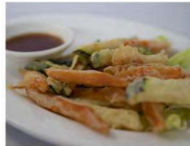
169/ Kariage €9,00 Verdure miste fritte e gamberi Allergeni: 1, 2