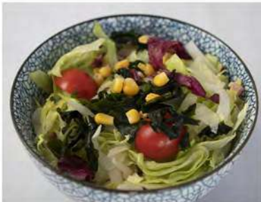
27/ Mikkusu salad €3,50 Insalata Mista