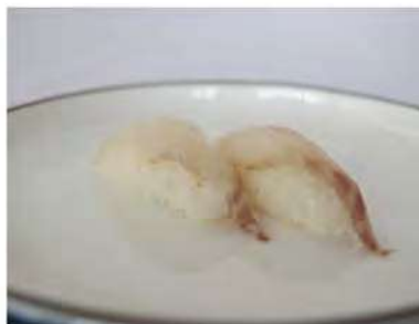
121/ Nigiri suzuki (2pz) €3,00 Bocconcini di riso con branzino