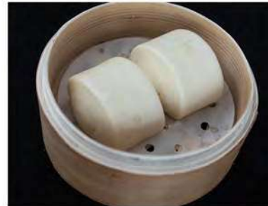
17/ Pane orientale €2,00 Pane cinese a doppia lievitazione Allergeni: 1, 7