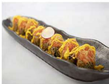
40/ Hosomaki fritto (8pz) €6,00 Roll di riso avvolti con alga nori fritti, farciti con salmone, guarniti con tartare di salmone e salsa alla zafferano Allergeni: 1