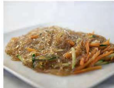
156/ Spaghetti di soia con verdure €5,00 Allergeni: 1, 6