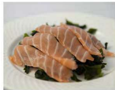
22/ Alghe sashimi €6,50 Salmone con alghe e salsa giapponese Allergeni: 14