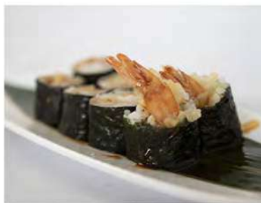
49/ Hosomaki ebi tempura (8pz) €5,00 Roll di riso farciti con tempura di gamberi, avvolti con alga nori e guarniti con salsa teriyaki Allergeni: 1, 2, 3, 6