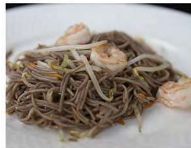
152/ Soba €7,00 Pasta di grano saraceno con gamberetti e verdure Allergeni: 1, 2