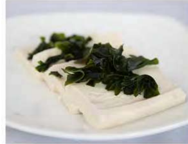
29/ Goma dofu €3,00 Tofu in insalata con salsa di soia Allergeni: 6