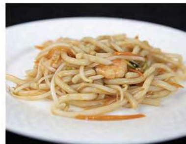
147/ Udon con gamberetti €7,00 Udon saltati con gamberetti e verdure Allergeni: 1, 2, 6