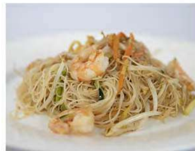
159/ Spaghetti di riso con gamberi e verdure €6,00 Allergeni: 1, 2, 3