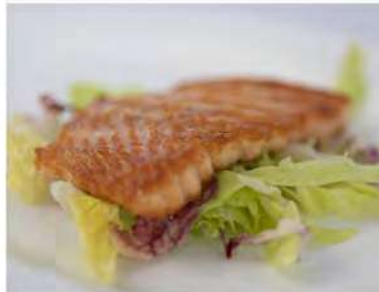
164/ Salmone alla griglia €6,50