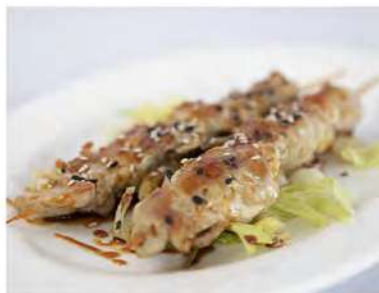
180/ Yaki tori €7,00 Spiedini di pollo con salsa teriyaki Allergeni: 6