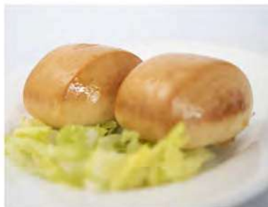
16/ Pane fritto €2,50 Pane dolce cinese con crema all'uovo Allergeni: 1, 3, 7