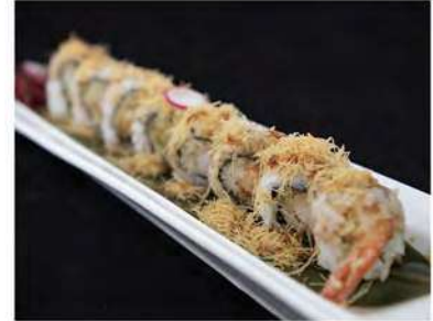
71/ Uramaki ebiten B (8pz) €9,50 Roll di riso farcito con gamberoni fritti maionese, salsa teriyaki e pasta katai Allergeni: 1, 2, 3, 6, 11