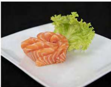
117/ Sashimi salmone €10,00 Fettine di salmone