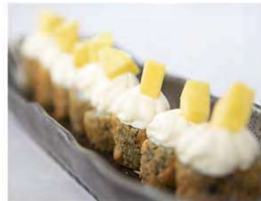
41/ Hosomaki mango (8pz) €6,00 Roll di riso avvolti con alga nori fritti, farciti con salmone e guarniti con philadelphia, mango fresco e salsa teriyaki Allergeni: 1, 6, 7