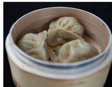
14/ Gyoza (3pz) €3,50 Ravioli ripieni di carne di maiale e verdure Alleggereni: 1, 3, 6