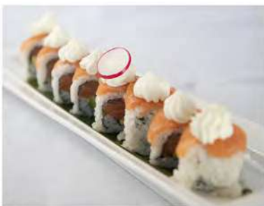
72/ Uramaki philadelphia (8pz) €10,00 Roll di riso farcito con salmone avocado e philadelphia Allergeni: 7, 11