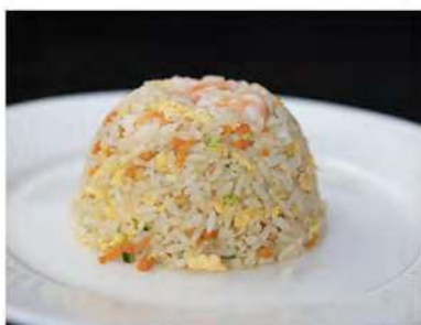
144/ Riso con gamberi €4,50 Riso saltato con gamberi e verdure Allergeni: 2, 3