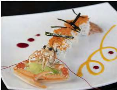
55/ Scampi roll (4pz) €14,00 Roll di riso con scampi e asparagi fritti con alga, salsa teriyaki e salsa rosa Allergeni: 2, 3