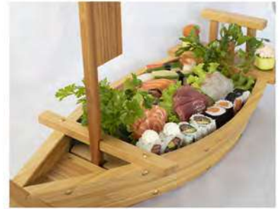
110/ Barca €20,90 9 sashimi, 6 hosomaki, 4 uramaki 6 nigiri, 2 gunkan Allergeni: 2