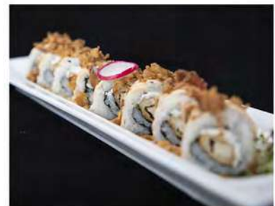
80/ Chicken roll B (8pz) €8,50 Roll di riso farcito con pollo fritto philadelphia, salsa rosa, ricoperto da cipolla fritta Allergeni: 1, 6, 7, 11