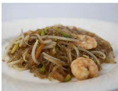
157/ Spaghetti di soia con gamberi e verdure €5,00 Allergeni: 1, 2, 6