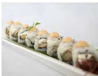
79/ Chicken roll (8pz) €8,00 Roll di riso farcito con pollo fritto philadelphia e salsa rosa Allergeni: 1, 6, 7, 11