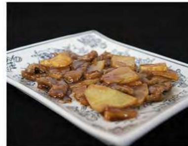
187/ Manzo con patate €6,50