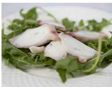
23/ Insalata di polpo €6,50 Insalata di polpo e rucola Allergeni: 14