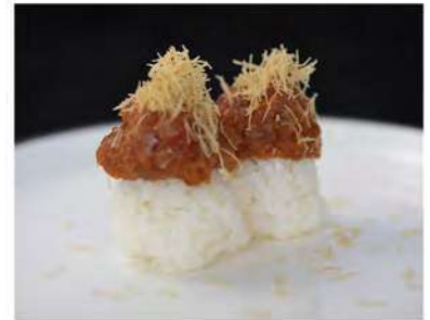
140/ Tamarizushi maguro €5,00 Bocconcini di riso con tartare di tonno e maionese Allergeni: 3