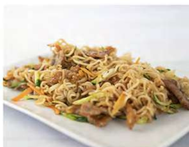
149/ Ramen con manzo €7,00 Ramen saltati con manzo e verdure Allergeni: 1