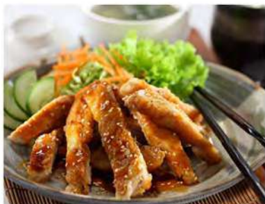
179/ Pollo teriyaki €7,00 Allergeni: 2