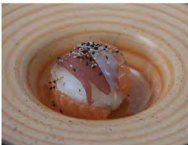
111/ Chirashi misto €12,00 Base di riso con sashimi misto Allergeni: 11