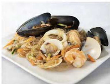
154/ Spaghetti di soia misto mare €6,50 Allergeni: 1, 2, 6, 14