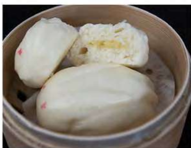
20/ Pane dolce €2,50 Allergeni: 1, 3, 7