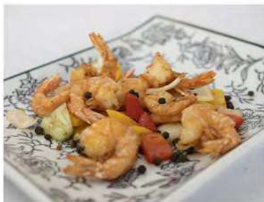
173/ Gamberetti sale e pepe €6,50 Allergeni: 2