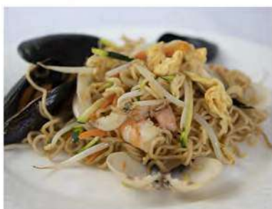
148/ Ramen ai frutti di mare €8,00 Ramen saltati con frutti di mare e verdure Allergeni: 1, 2, 14