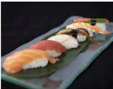
108/ Nigiri misto €7,00 6 nigiri misti Allergeni: 2