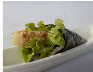
97/ Temaki ebiten €4,00 Cono di riso avvolto da alga nori con gamberoni fritti, maionese salsa teriyaki e insalata Allergeni: 1, 2, 3, 6