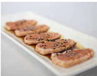
30/ Sake tataki €9,00 Salmone scottato con sesamo condito con salsa ponzu Allergeni: 6, 11