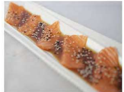
113/ Carpaccio di salmone €8,00 Fettine di salmone condite con salsa ponzu Allergeni: 6, 11