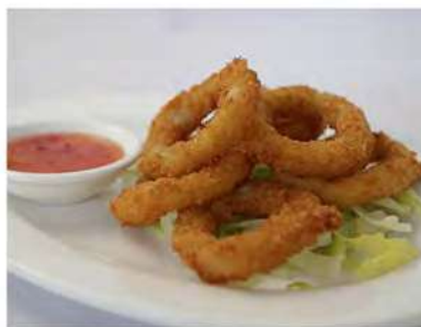
177/ Calamari fritti €7,50 Allergeni: 1, 3, 14