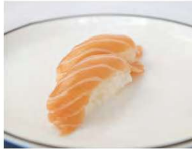
124/ Nigiri sake (2pz) €3,00 Bocconcini di riso con salmone