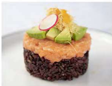
39/ Black tartare €9,50 Tartare di salmone con riso venere ricoperto con avocado, pasta kataifi e salsa al mango Allergeni: 1