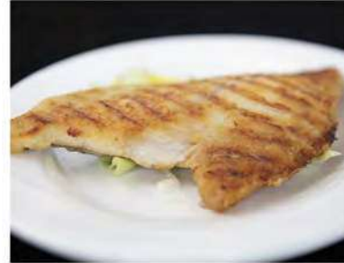
165/ Orata alla griglia €6,50