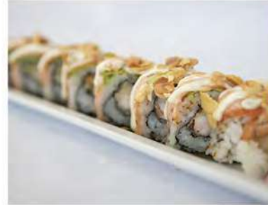
82/ Uramaki tiger speciale (8pz) €12,00 Roll di riso farcito con gambero fritto e avocado avvolto con salmone scottato e mandorle Allergeni: 1, 2, 6, 8