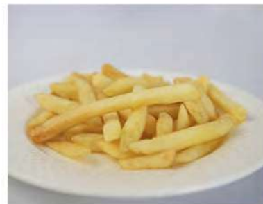
09/ Patatine fritte €2,00