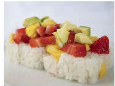
74/ It fruit (8pz) €14,00 Roll di riso farcito con banana, maionese, guarnito con fragola, mango e avocado Allergeni: 3