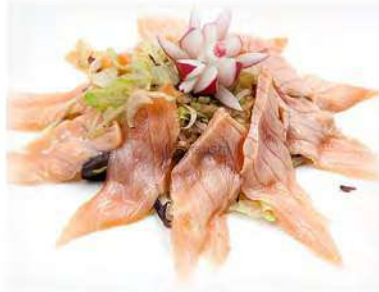
115/ Carpaccio sake scottato €12,00 Fettine di salmone scottato condite con salsa ponzu Allergeni: 6, 11