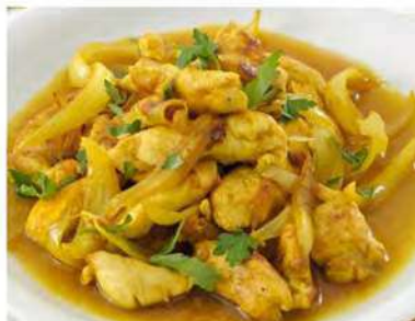
183/ Pollo al curry €5,50