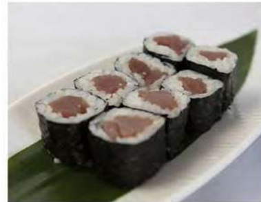
47/ Hosomaki tekka (8pz) €5,00 Roll di riso farciti con tonno e avvolti con alga nori