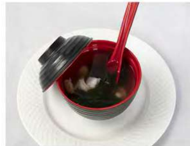
32/ Zuppa di pesce €4,00 Zuppa di pesce con miso Allergeni: 14