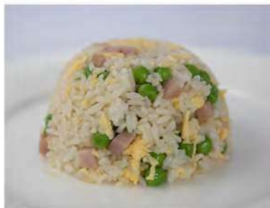
143/ Riso alla cantonese €4,00 Riso con piselli, prosciutto e uovo Allergeni: 3, 6