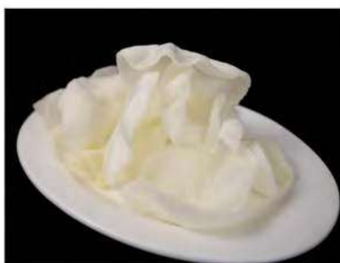
05/ Nuvole di drago €1,50