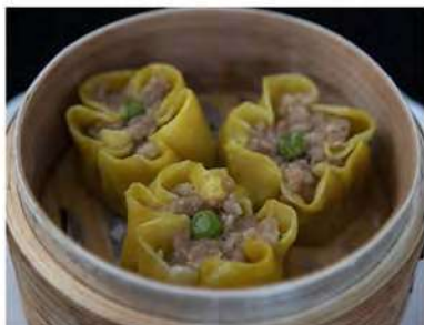
15/ Shao mai (3pz) €4,00 Ravioli ripieni di gamberi, carne di maiale e zafferano Allergeni: 1, 2, 3, 6