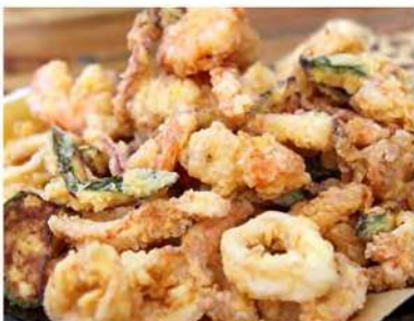
170/ Tempura di mare €11,00 Pesce misto fritto Allergeni: 1, 2