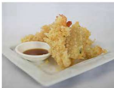
168/ Tempura mista €10,00 Tempura di gamberoni e verdure miste Allergeni: 1, 2