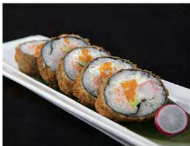
52/ Futo fritto (5pz) €6,50 Roll di riso con salmone, surimi di granchio, philadelphia, tobiko avvolti con alga nori, avocado, fritti e guarniti con salsa teriyaki Allergeni: 1, 2, 6, 7