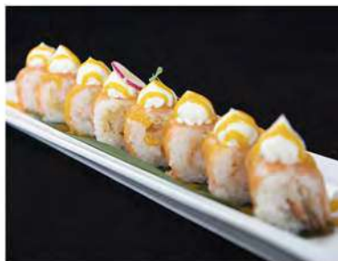
89/ Ebi fresh (8pz) €10,00 Roll di riso con tempura di gamberoni maionese, guarnito con salmone philadelphia e salsa mango Allergeni: 1, 2, 3, 7