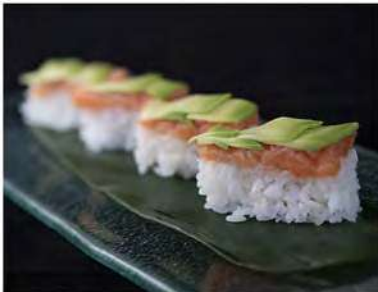
92/ Saudate (4pz) €13,00 Rettangoli di riso con spicy salmon e avocado Allergeni: 7