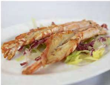
163/ Gamberoni alla griglia €9,00 Allergeni: 2