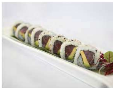
61/ Uramaki tonno avocado (8pz) €8,00 Roll di riso farcito con tonno e avocado Allergeni: 11