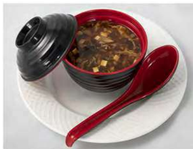
34/ Zuppa agropiccante €3,00 Zuppa di verdure in salsa agropiccante con tofu e uovo Allergeni: 3