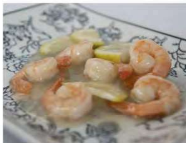
174/ Gamberetti al limone €6,50 Allergeni: 2