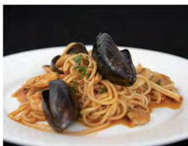
161/ Spaghetti ai frutti di mare €8,50 Allergeni: 1, 2, 14