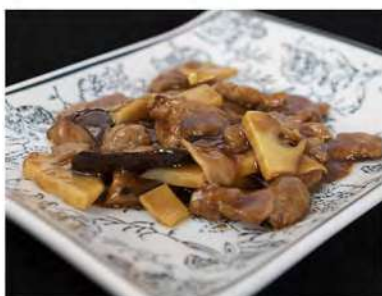
188/ Manzo con funghi e bambù €6,50