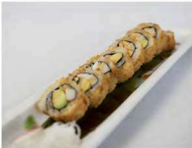
69/ California fritto (8pz) €9,00 Roll di riso fritto, farcito con surimi gambero cotto e avocado Allergeni: 2, 11