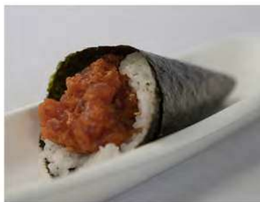
96/ Temaki spicy tuna €4,00 Cono di riso avvolto da alga nori con tartare di tonno e salsa piccante Allergeni: 3