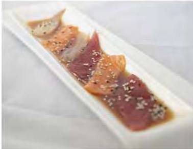
114/ Carpaccio misto €9,00 Fettine di pesce misto condite con salsa ponzu Allergeni: 6, 11