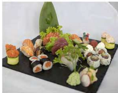
109/ Sushi sashimi speciale €28,00 8 nigiri, 4 gunkan, 2 uramaki 4 hosomaki, 9 sashimi Allergeni: 2