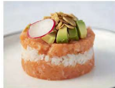
38/ Hamburger tartare €9,50 Riso, avocado, salmone e scaglie di mandorle Allergeni: 8