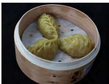
10/ Ravioli di verdure €3,00 Alleggereni: 1