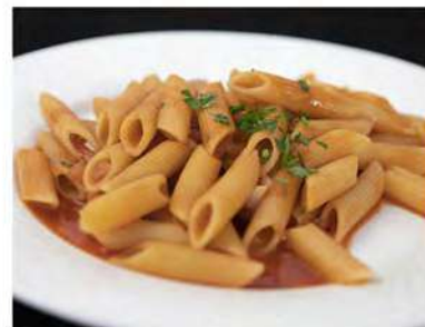
162/ Penne al pomodoro €6,00 Allergeni: 1