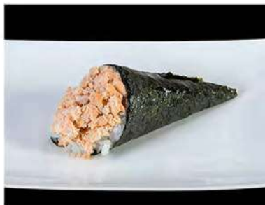
99/ Temaki miura €4,00 Cono di riso avvolto da alga nori con salmone grigliato e salsa teriyaki Allergeni: 6