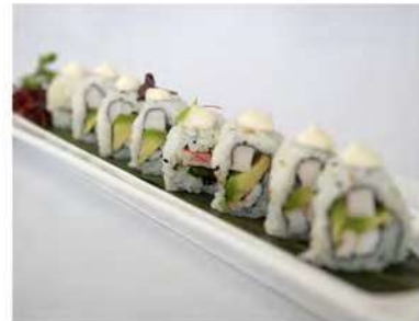
68/ Uramaki california (8pz) €9,00 Roll di riso farcito con surimi gambero cotto e avocado Allergeni: 2, 11