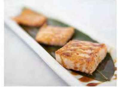
116/ Salmone scottato €6,00 Salmone scottato in salsa teriyaki Allergeni: 6, 11