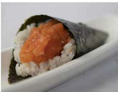
95/ Temaki spicy salmon €4,00 Cono di riso avvolto da alga nori con tartare di salmone e salsa piccante Allergeni: 3