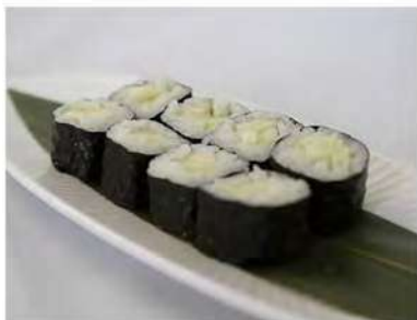
45/ Hosomaki kappa (8pz) €4,00 Roll di riso farciti con cetriolo e avvolti con alga nori