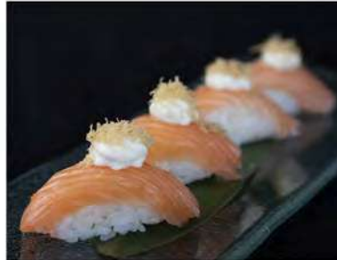
105/ Nigiri speciale (4pz) €6,00 Salmone con philadelphia e pasta kataifi Allergeni: 7