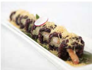
88/ Black ebiten (8pz) €10,00 Roll di riso venere farcito con tempura di gambero, maionese salsa teriyaki e pasta kataifi Allergeni: 1, 2, 3, 6