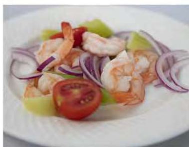
24/ Insalata di gamberi €6,50 Cipolla, pomodorini, sedano e gamberi cotti Allergeni: 2, 9