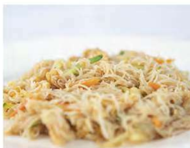
158/ Spaghetti di riso con verdure €5,00 Allergeni: 1