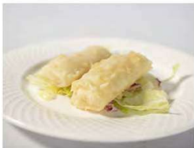
01/ Harumaki €3,50 Croccante involtino di pasta con ripieno di gamberi, carota e cipolla Alleggereni: 1