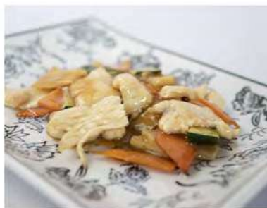
186/ Pollo e verdure €5,50 Pollo con verdure miste