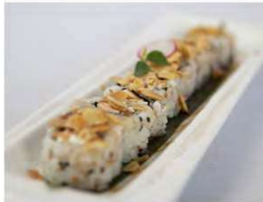
58/ Miura mandorle (8pz) €9,00 Roll di riso farciti con gamberetti cotti e avvolti con alga nori Allergeni: 6, 7, 8, 11