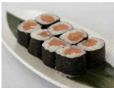
48/ Hosomaki sake (8pz) €4,50 Roll di riso farciti con salmone e avvolti con alga nori