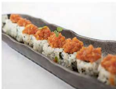
63/ Uramaki spicy tuna (8pz) €11,00 Roll di riso farcito con tonno maionese e tobiko(piccante) Allergeni: 3, 11