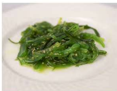
21/ Goka wakame €3,50 Alghe piccanti marinate con sesamo Allergeni: 11