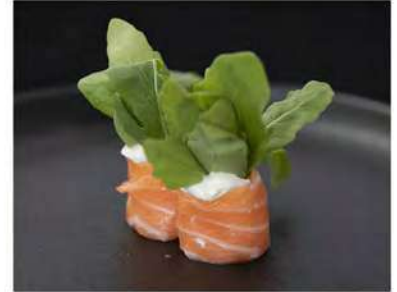
130/ Gunkan philadelphia e rucola €5,00 Involtini di salmone, guarniti con philadelphia e rucola Allergeni: 7