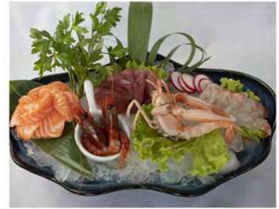
119/ Sashimi speciale €24,90 9 fette di sashimi, 2 gambero rosso 1 scampo Allergeni: 2