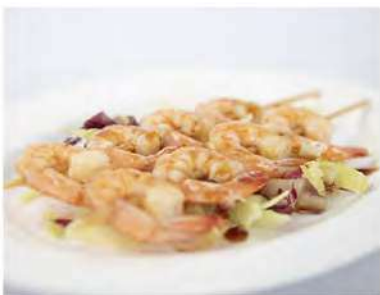
200/ Spiedini di gamberetti €7,00 Allergeni: 2