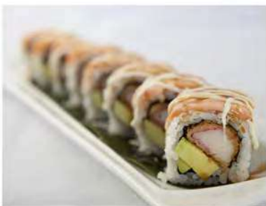
83/ Uramaki speciale (8pz) €12,00 Roll di riso farcito con surimi di granchio, gambero cotto, avocado maionese guarnito con salmone scottato e salsa teriyaki Allergeni: 1, 2, 3, 6