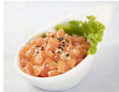
36/ Sake tartare €8,00 Tartare di salmone con salsa ponzu Allergeni: 6, 11