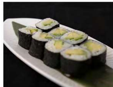
44/ Hosomaki avocado (8pz) €4,00 Roll di riso farciti con avocado e avvolti con alga nori