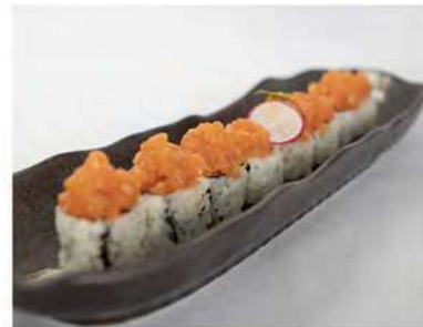
62/ Uramaki spicy salmon (8pz) €10,00 Roll di riso farcito con salmone maionese e tobiko(piccante) Allergeni: 3, 11