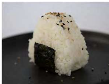
53/ Onigiri miura €5,00 Polpetta di riso triangolare con pasta kataifi, farcita con salmone saltato, cipolla e philadelphia Allergeni: 11, 7